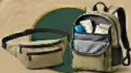
حقيبة صغيرة حقيبة للظهر أو للخصر