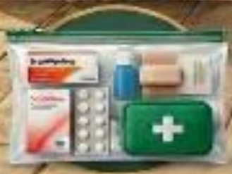
صندوق الإسعافات الأولية مجموعة طبية متكاملة