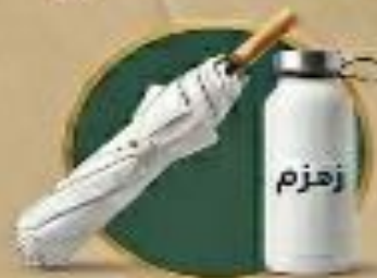
مظلة + قارورة ماء للحماية من الشمس والترطيب