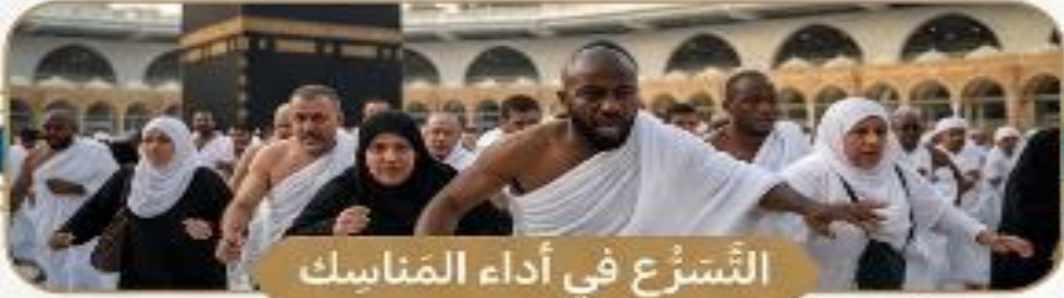
التسرع في أداء المناسك