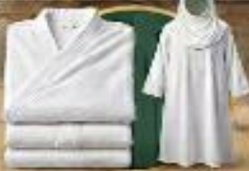
ملابس الإحرام طقم قطني مريح