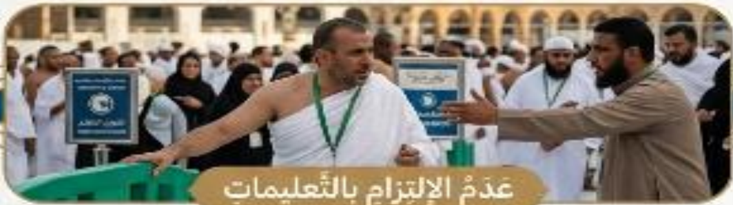
عدم الالتزام بالتعليمات

ركزوا على العبادة، فإنَّ المقامَ عظيمٌ. تجنّبوا تعطيلَ الغيرِ والانشغالَ بالهواتف.