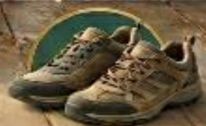
حذاء مريح أحذية طبية للمشي