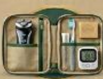
أدوية أساسية مسكنات، مطهر، وأدوية شخصية